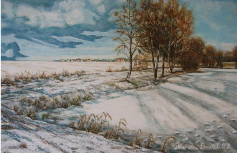
Bei den Teichen in Schierhorn